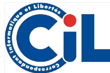
Image et communication – Engagement éthique et responsable - Confiance