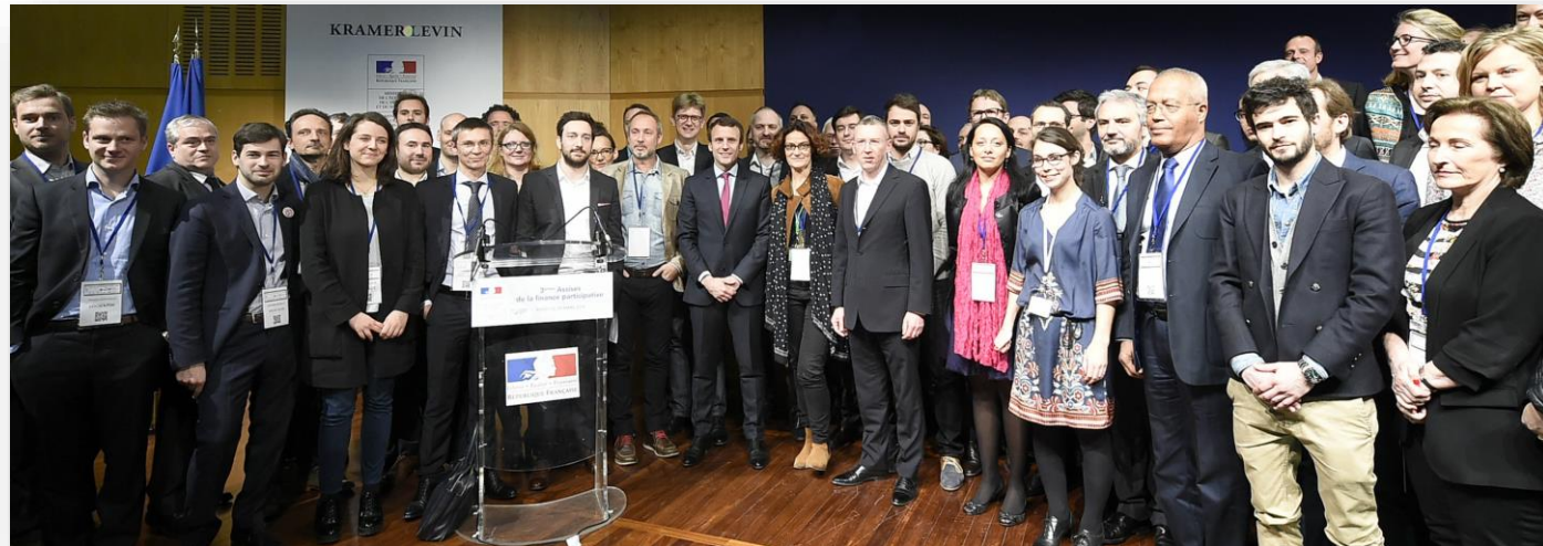
FINANCEMENT PARTICIPATIF FRANCE